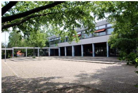
V.i.S.d.P.: Schulleitung PGS-ASS